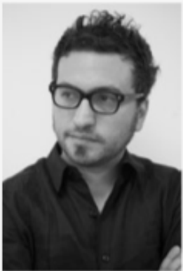
Alonso Ruizpalacios Dirección