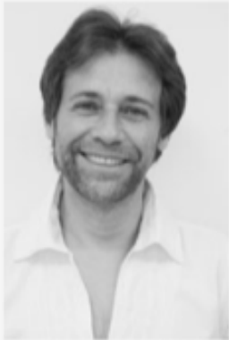
Juan Manuel Bernal Actor