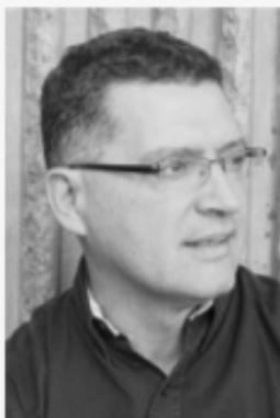
Alfredo Michel Traducción y adaptación