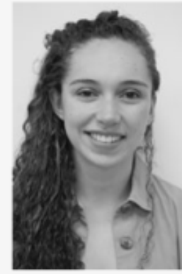
Esmirna Barrios Actriz