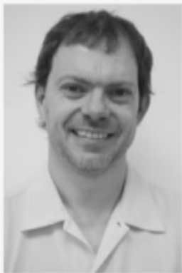
Gastón Yanes Actor