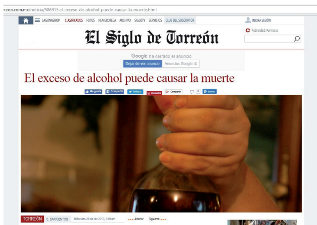
Figura 3. Página de Internet seleccionada por los estudiantes