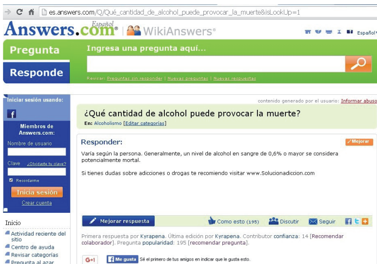
Figura 1. Primer resultado de la búsqueda de información en Internet

culos. Por momentos se observa que quisieran explorarlos, pero prefieren esperar a que se despliegue la información del enlace que eligieron. Después de casi dos minutos se muestra la pantalla como en la Figura 1.