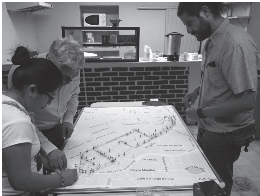
Participantes de El puro lugar trazan sus recorridos sobre un mapa del barrio.

En pequeños grupos de tres o cuatro personas, nos encontramos juguetonamente negociando con el otro nuestros movimientos en torno al mapa, a fin de lograr un registro de lo que tentativamente recordábamos. El ejercicio funcionó para ubicarnos más claramente en los entrecruces entre el espacio