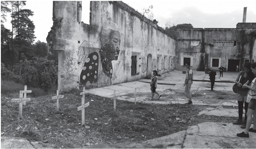
Patio de la Fábrica de San Bruno con el panteón simbólico durante el Capítulo 1 de El puro lugar . Fotografía de Antonio Prieto, 2016.

instalación conceptual de la obra era en realidad un homenaje elaborado por los vecinos del barrio.