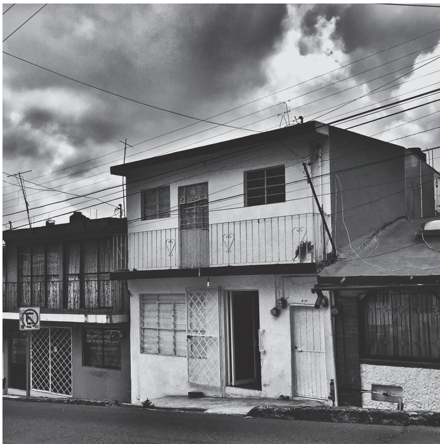
El departamento de la calle Herón Pérez de Xalapa, Veracruz. En la planta baja se realizó la escenificación de diversos momentos de El puro lugar .

El cuartito está ubicado en la calle Herón Pérez, que es el nombre de un joven asesinado junto con once trabajadores de la Fábrica de San Bruno, el 28 de agosto de 1924. Esta coincidencia ayudó a vincular la violencia cercana