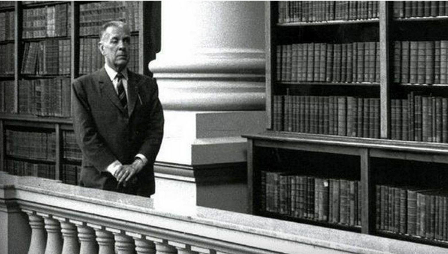
Jorge Luis Borges