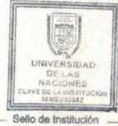
Sello de Institución

Registro de la Dirección General de Profesiones