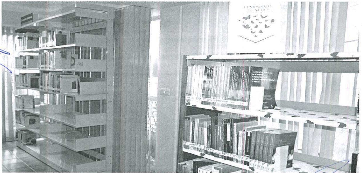
La sección “Feminismos, género y derechos humanos de las mujeres” cuenta con más de 100 libros y fuentes bibliográficas