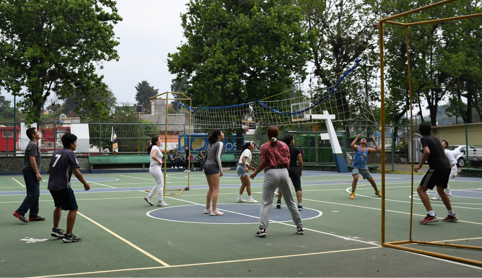
Alumnas y alumnos realizando actividades deportivas en la Unidad de Ciencias de la Salud de Xalapa. Dirección General de Tecnologías de la Información.