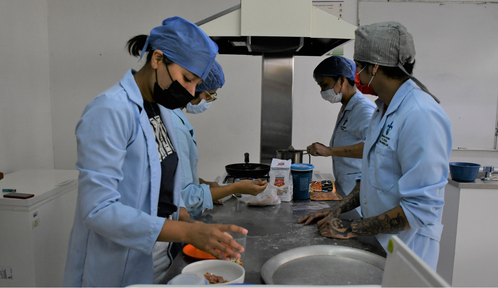
Alumnas y alumnos en un taller de la Facultad de Nutrición de Xalapa. Dirección General de Tecnologías de la Información.