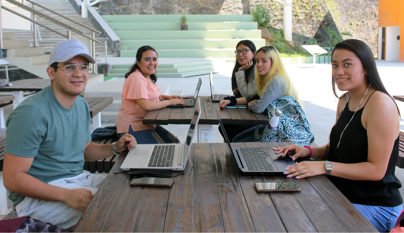
Alumnas y alumno en espacio de trabajo y convivencia abierto de la Facultad de Ciencias Administrativas y Sociales de Xalapa. Dirección de Planeación Institucional.