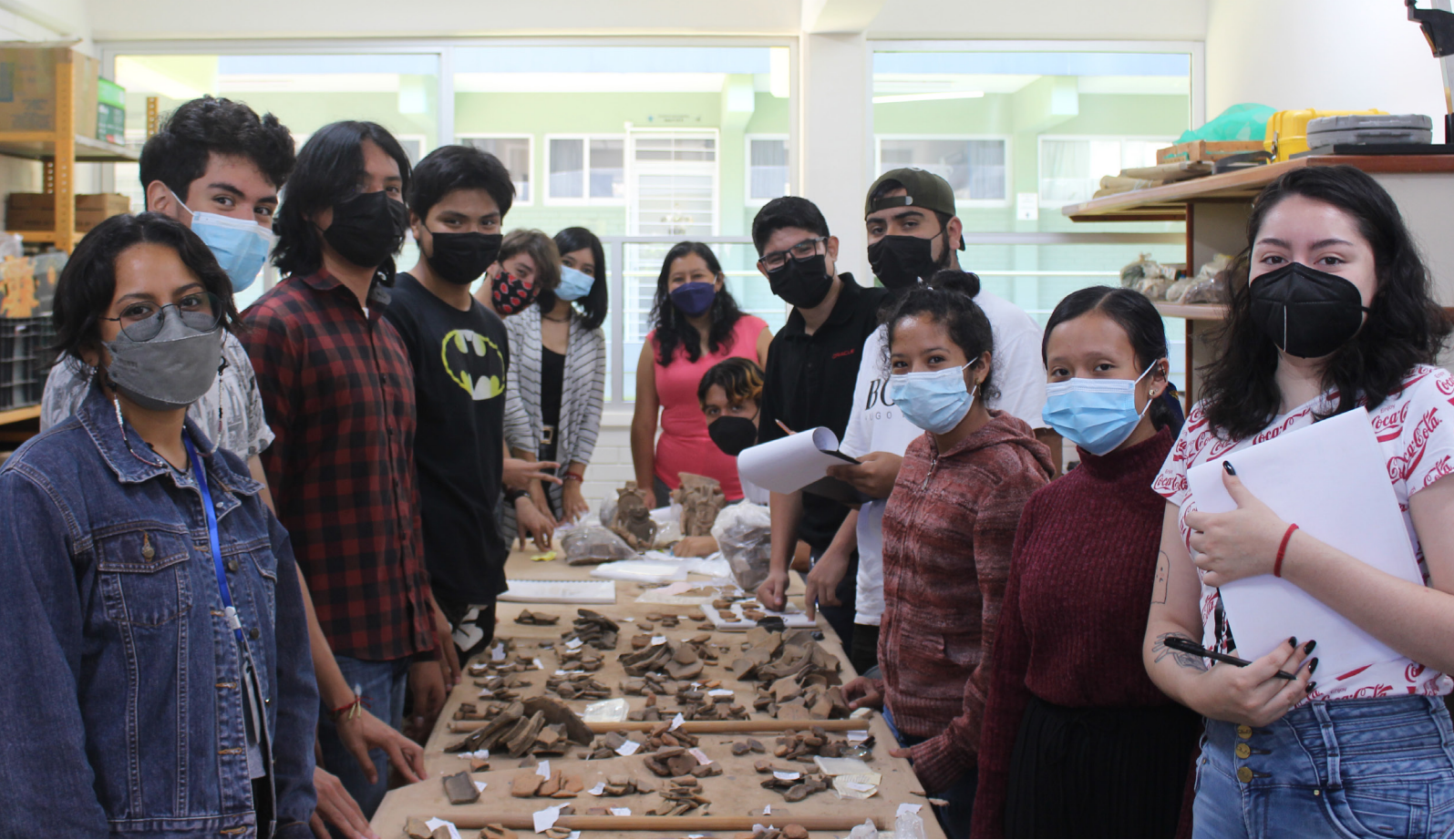
Alumnas, alumnos y académica en un taller de la Facultad de Antropología de Xalapa. Dirección de Planeación Institucional.