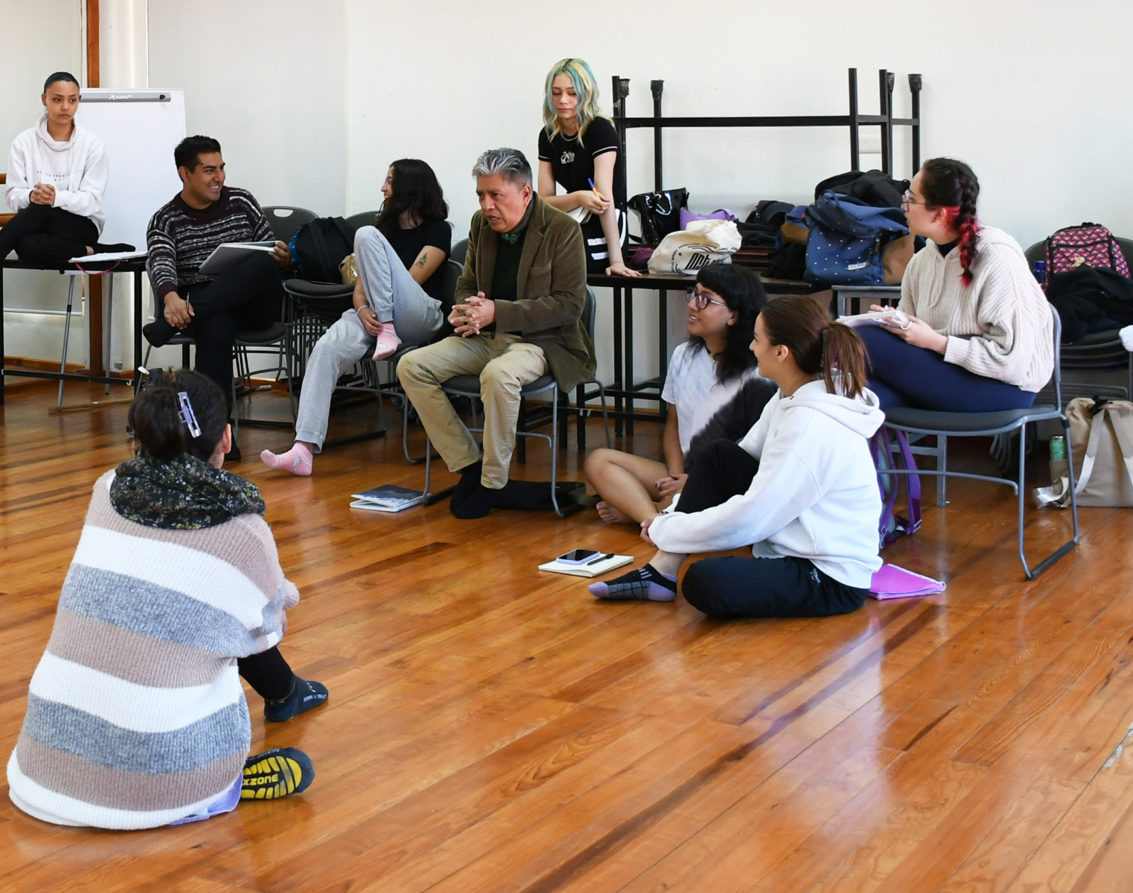
Alumnas, alumnos y académico de la Facultad de Teatro de Xalapa. Dirección General de Tecnologías de la Información.