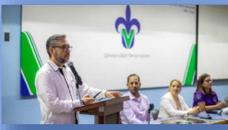
Facultad de Contaduría y Administración.

Objetivo. En el transcurso de este periodo, hemos dedicado esfuerzos significativos para fomentar un ambiente inclusivo y respetuoso en nuestra universidad, reconociendo la importancia de la equidad de género y la diversidad sexual. Nuestra misión ha sido cultivar un entorno educativo donde cada individuo, independientemente de su identidad de género u orientación sexual, se sienta valorado y empoderado. A lo largo de diversas actividades y charlas, hemos buscado no solo sensibilizar a nuestra comunidad académica sobre estas cuestiones cruciales, sino también implementar medidas tangibles que promuevan la igualdad y la aceptación. Por lo que, se han llevado a cabo diversas actividades que se describen a continuación: