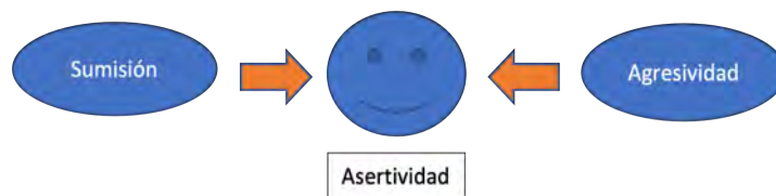
Imagen 2. La asertividad.

Se puede entender la sumisión como la conducta pasiva del individuo al participar en un proceso de comunicación, así mismo, la agresividad se entiende como a las personas que no respetan o no entienden la forma de pensar de quien participa en el proceso de comunicación.