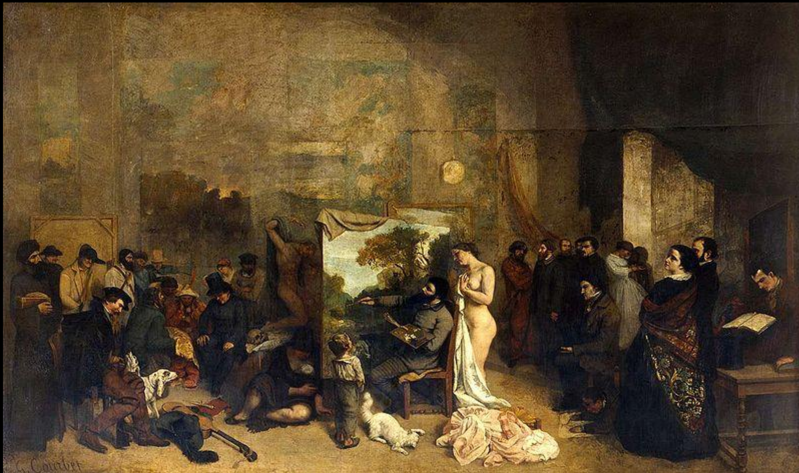
El taller del pintor, alegoría realista, determinante de una fase de siete años de mi vida artística y moral. Courbet, 1855.

“Es la historia moral y física de mi taller”. La escena tiene lugar en el taller de Courbet en París. Se divide en tres partes: en el centro, el artista pintando un paisaje de su imaginación (naturalismo), atrás de él una modelo desnuda a la que le da la espalda (romanticismo), al frente un niño lo mira tratando de llamar su atención, ignorado por el artista y junto al niño un gato que juega con la seda del vestido de la mujer (rococó); a la derecha, los «simpatizantes»; a la izquierda, «los que viven de la muerte y la miseria». Detrás del lienzo aparece un maniquí crucificado que representa a San Sebastián atravesado por flechas, simbolizaría a la Academia (neoclásica).