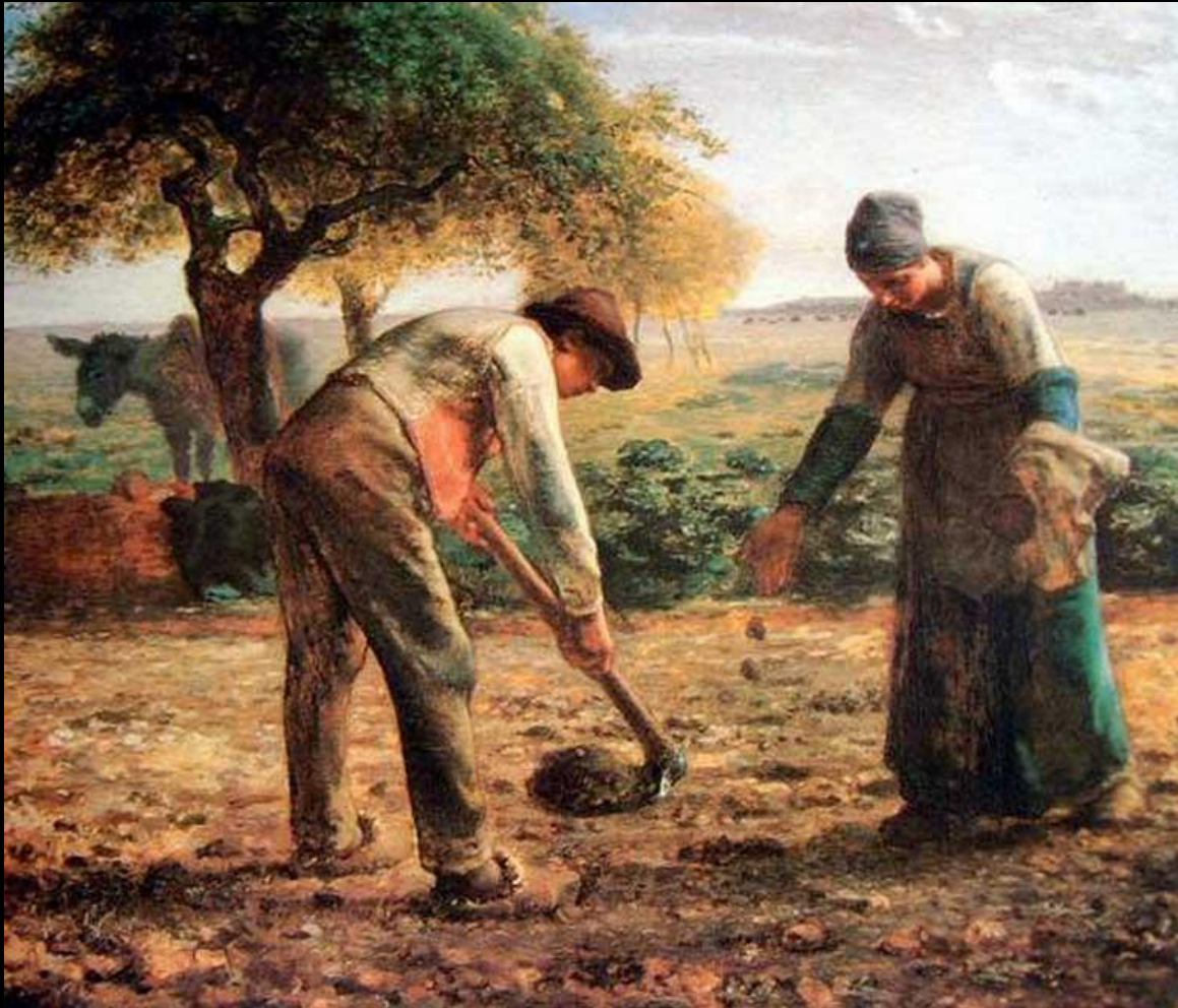
Sembrando papas. Millet , 1855.

Jean-François Millet , perteneció al círculo de los pintores de la Escuela naturalista Barbizon , que surgió en reacción al más formalista Romanticismo. Sin embargo, Millet, fue más allá de la idea original, acercándose al realismo pictórico, por lo que incluyó figuras humanas en sus paisajes llenas de esperanza y desamparo, estampas de la vida campesina y del trabajo real en el campo. Para él era más importante el hombre que el escenario natural.