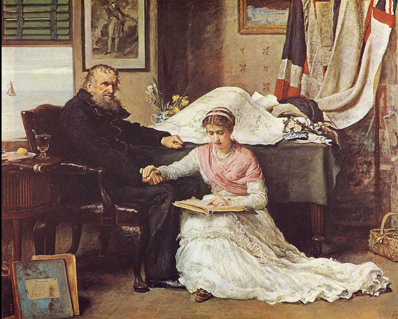
El paso del noroeste. Millais. Inglaterra. 1847.

El realismo inglés , pasó del retratismo figurado de la realidad hacia una realidad cuestionada y discutible. Así, John Everett Millais (1829-1896), fue un pintor e ilustrador realista inglés quien evolucionaría hacia una forma figurativa cada vez más subrayada por la línea y bajo temas críticos acerca de la construcción de la nueva la sociedad industrial.