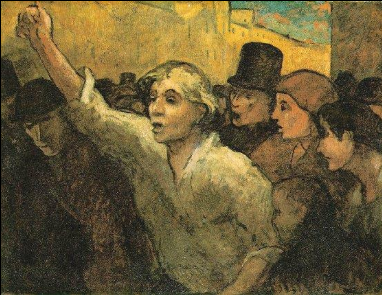
El Levantamiento (L'emeute). Daumier.

Siendo un movimiento que choca contra todos los anteriores se expresa por sus artistas bajo un Manifiesto Realista : La única fuente de inspiración en el arte es la realidad; No admite ningún tipo de belleza preconcebida; La única belleza válida es la que suministra la realidad, y el artista lo que debe hacer es reproducirla, sin embellecerla, descubrir cómo lograr captar la belleza particular de cada ser u objeto.