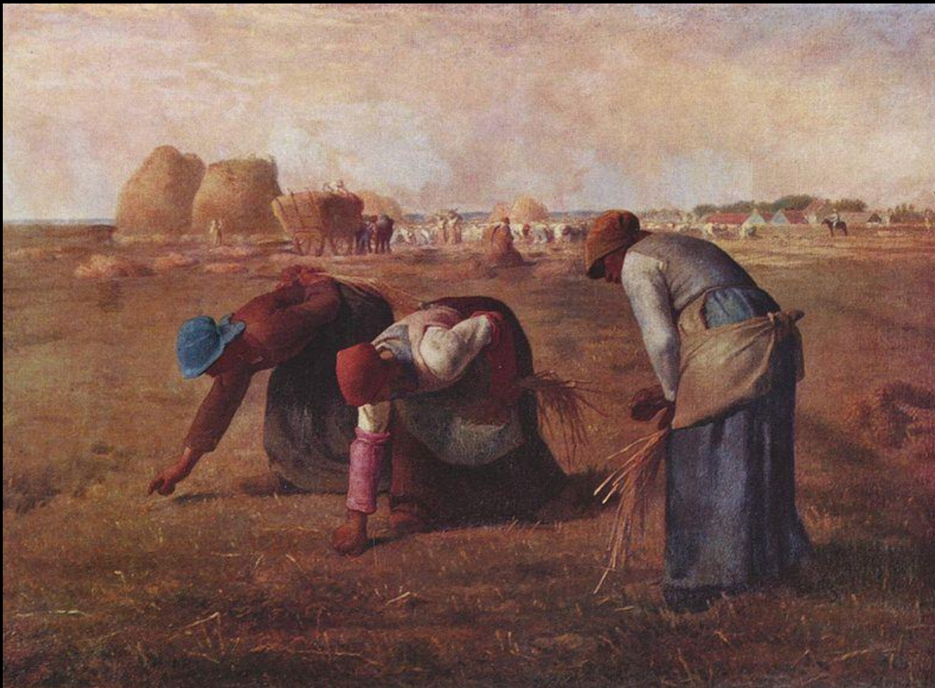
Las espigadoras Jean-François Millet . 1857. Museo de Orsay de París.

Las mujeres, ataviadas con la vestimenta típica normanda, recogen inclinadas los restos de la cosecha, el trabajo más duro y menos reconocido entre las tareas rurales . La posición de las campesinas -una de ellas, la que se encuentra a la izquierda del cuadro, apoya su mano en la espalda dolorida- y la hora en que se manifiesta la escena, dan cuenta de la fatiga que representa su labor. Sin embargo, Millet sitúa los personajes en primer plano, en una actitud de estoicidad introspectiva y silenciosa.