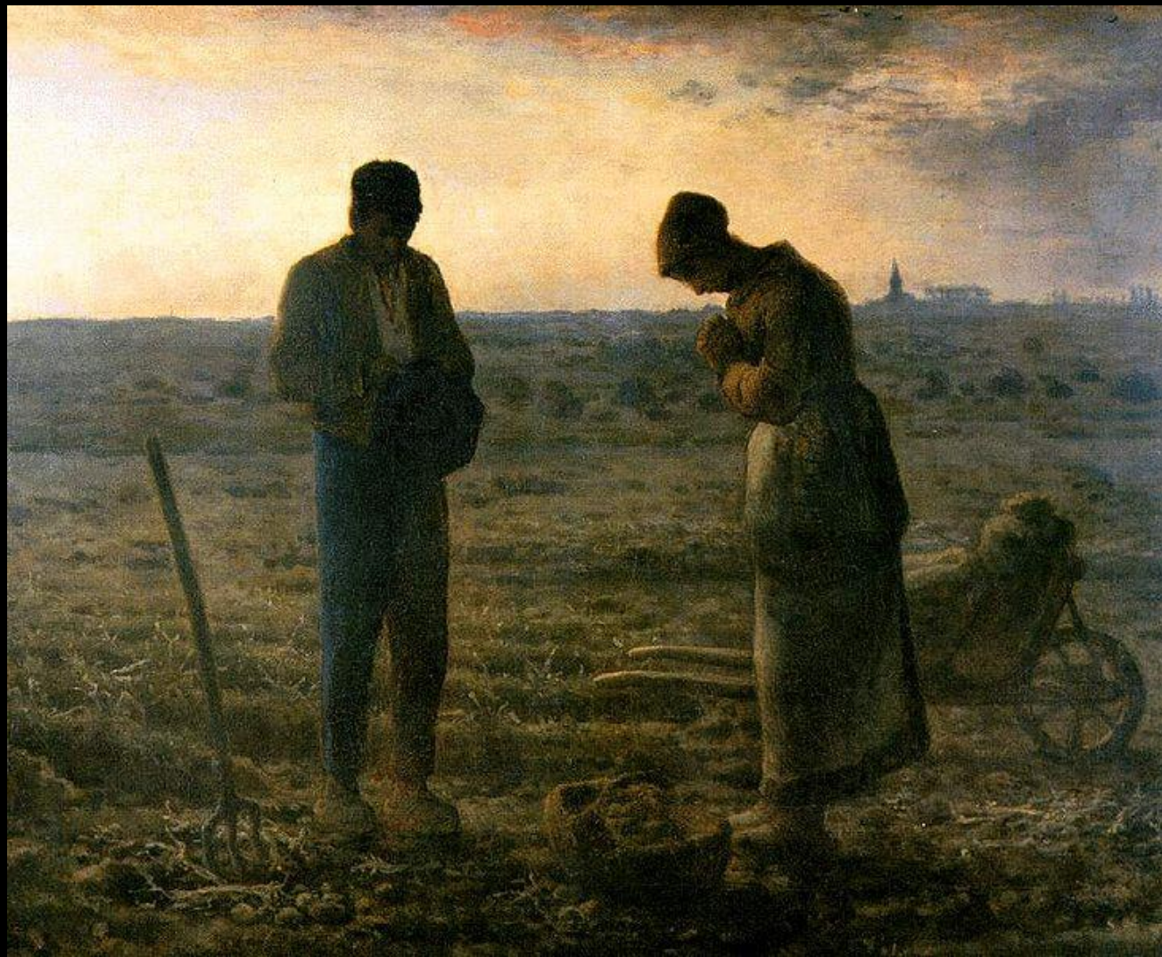
El Ángelus. Millet. 1857.