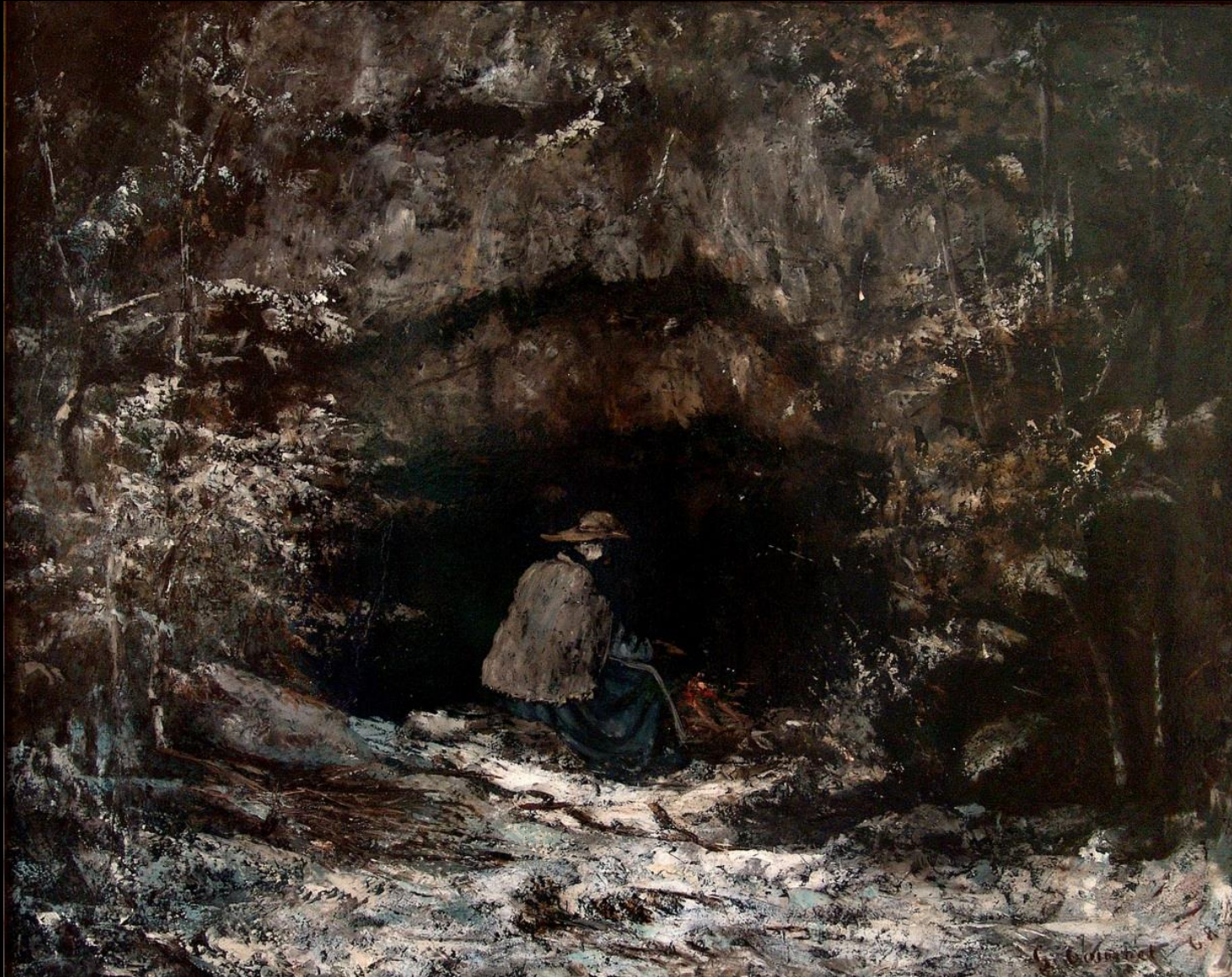
El Invierno, Courbet , 1868.

En el Realismo pictórico francés podemos encontrar como sus máximos artistas a: Courbet (1819-1877); Daumier (1808-1879) y Millet (1814-1875).