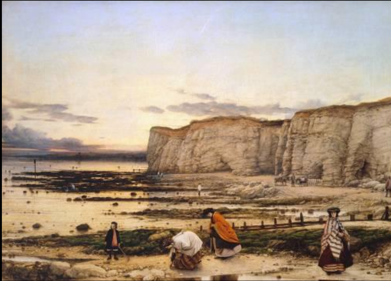
La bahía de Pegwell. William Dyce 1860. Tate Britain.

William Dyce , pintor y decorador escocés, de gran prestigio por sus obras al fresco para el Palacio de Buckingham. Cultivó el realismo en sus obras de temas bíblicos, retratos y paisajes con atmósferas místicas análogo al de los artistas alemanes. Como persona profundamente religiosa, ejemplo de anglocatólico, trabó amistad con los nazarenos.