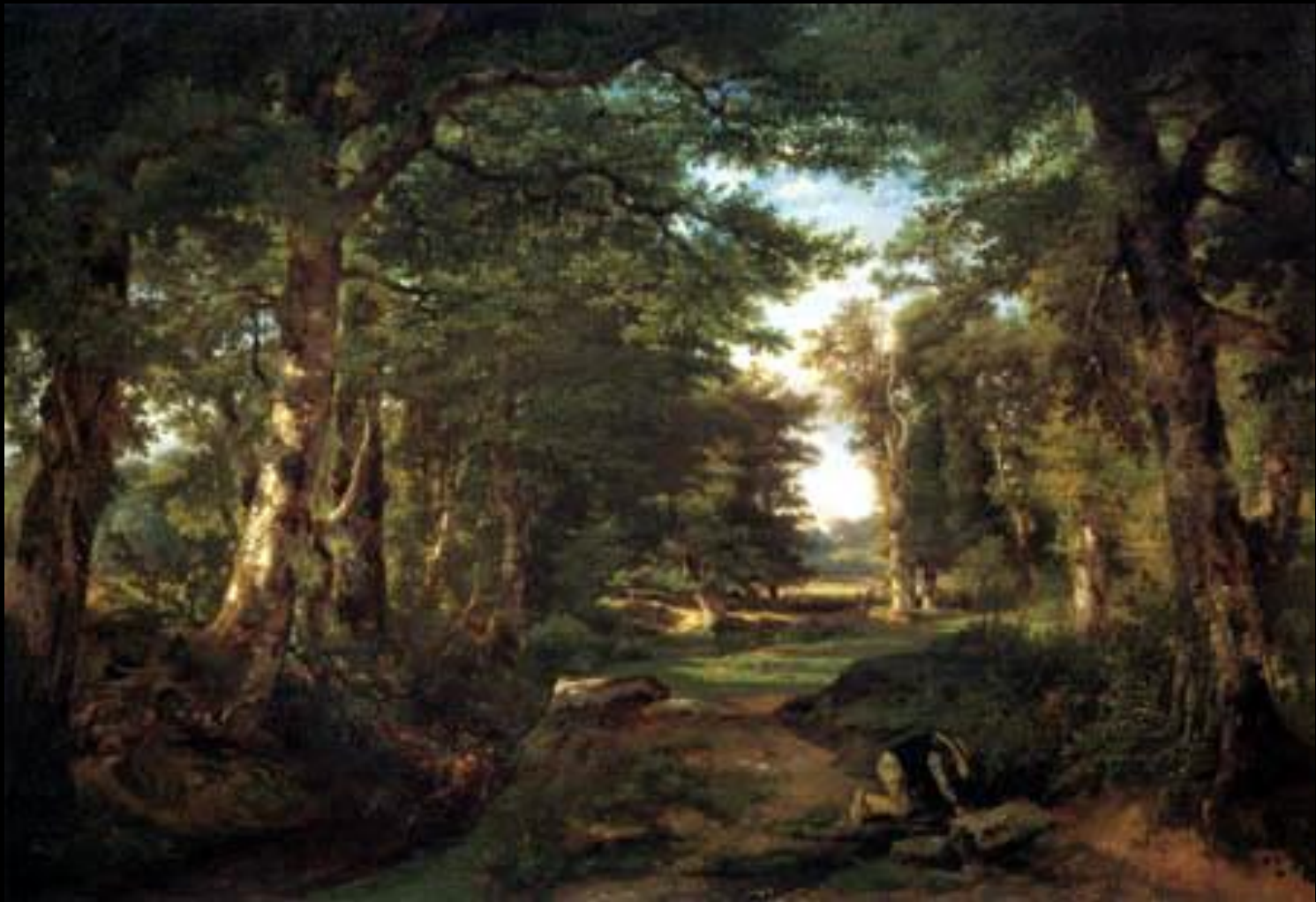
Camino del bosque. Constant Troyon (1810-1865).

El paisajismo tiene una intención de presentar las veredas, los caminos, arboladas, ríos y lagos como posibles blancos de la explotación del hombre “naturalista” propio de la Segunda Revolución Industrial. Troyon gusta del efecto de la luz de los atardeceres.