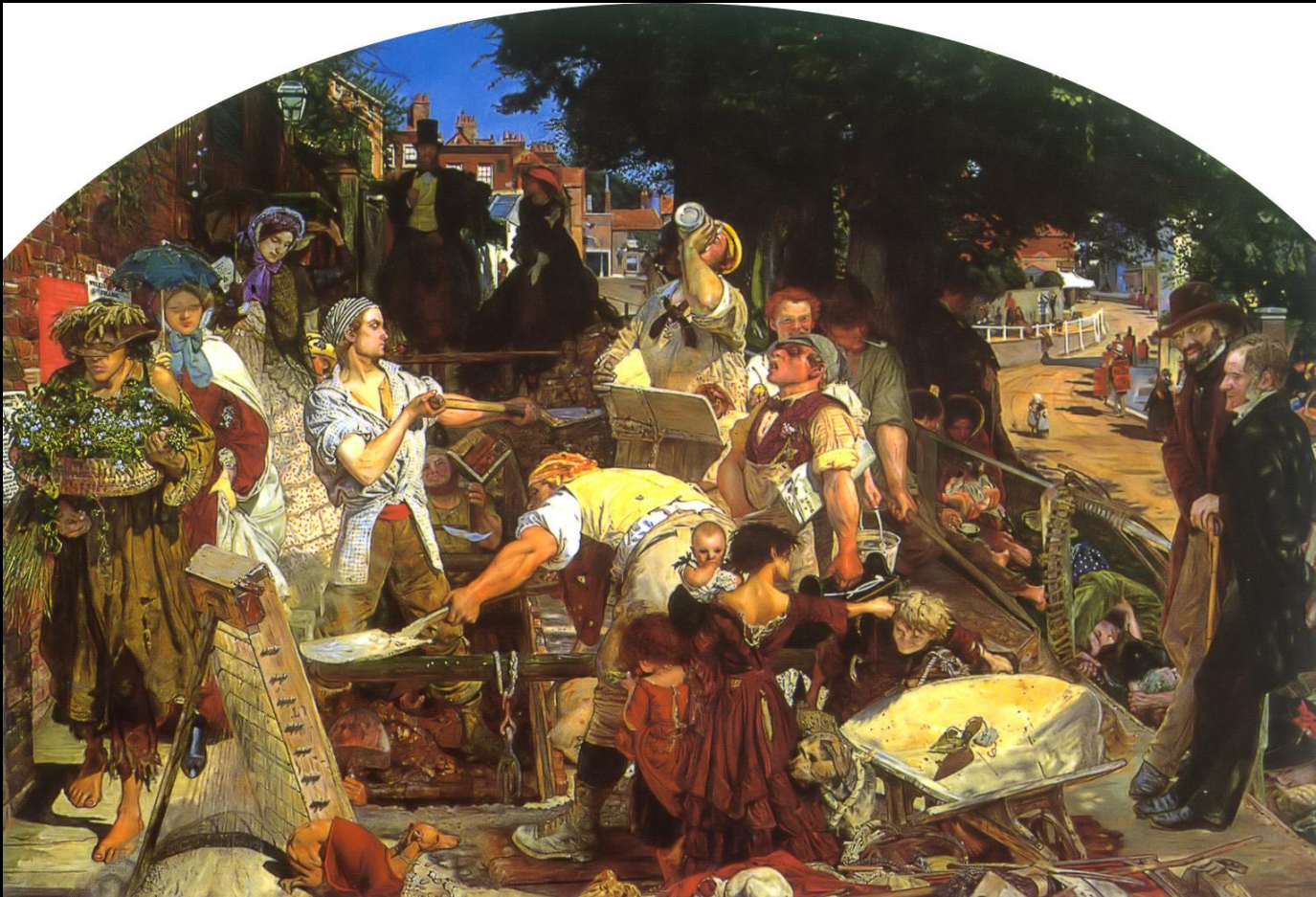
El trabajo. Ford Madox. 1852-1863.

Ford Madox Brown , pintor realista inglés, se dedicó sobre todo a la pintura histórica, de tema bíblico y al final de tema social . Su carácter retraído y solitario y problemas de índole personal sumados a su interés por los problemas de la época como la desigualdad social, la industrialización y la emigración, produjeron una obra intensa cuyos temas cambiaban en tanto que el estilo siempre era el mismo.