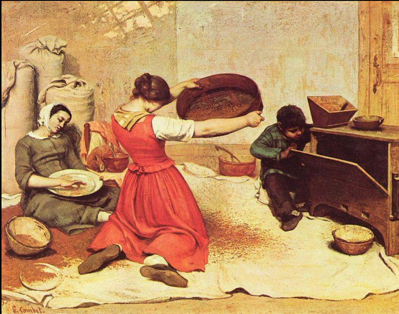
Las cribadoras, Gustave Courbet, 1859.

Los pintores realistas tienen una preferencia por los temas campesinos y obreros, en lugar de temas históricos y gloriosos. Suelen pintar lienzos de gran formato en el que lo principal es la figura humana, particularmente su esfuerzo, esperanza, condena y desilusión.