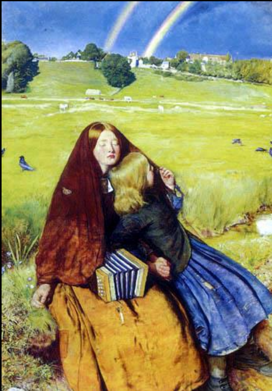
La muchacha ciega. Millais. Inglaterra. 1854-56. Birmingham Museums & Art Gallery .

La muchacha ciega es una obra realista porque presenta la belleza en una figura serena, llena de dignidad, con la expresión sosegada de la joven, estática, quien junto con su lazarillo, quizá su hermana por el fuerte lazo afectivo mostrado, puede mirar el arco iris. Ambas muestran clara evidencia de pobreza económica por sus vestidos raídos.