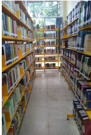
Facultad de Sociología, U. V. Licenciatura

¡La facultad de Sociología te está esperando!