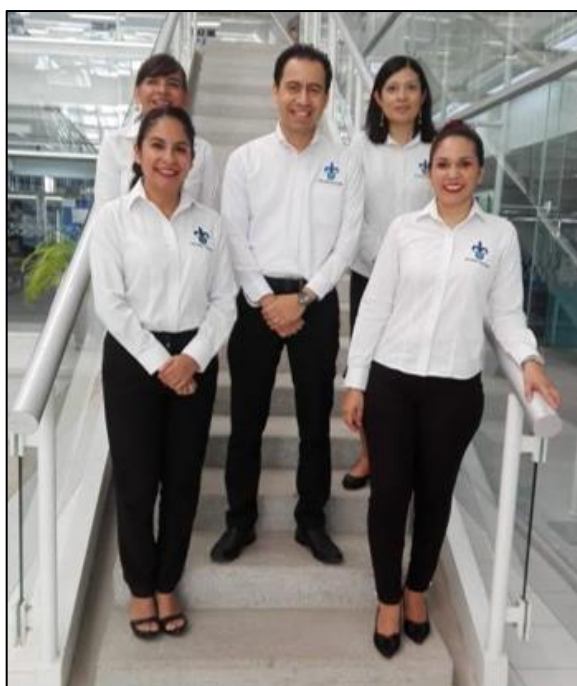
Personal de la Coordinación Regional de Bibliotecas Región Veracruz

El Plan de Desarrollo de la Dependencia (Plade) de la Coordinación Regional de Bibliotecas, expone la participación de los actores que conforman el sistema bibliotecario regional y como interaccionan de manera sistemática para ofrecer servicios de calidad para la comunidad universitaria bajo los principios establecidos por la legislación universitaria y el Programa de Trabajo 2021 – 2025 Por una Transformación Integral .