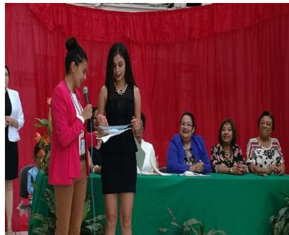
Chico y chica Enfermería.