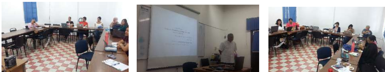
Tabla 2.3.1 ACADÉMICOS QUE PARTICIPARON EN EL PROFA