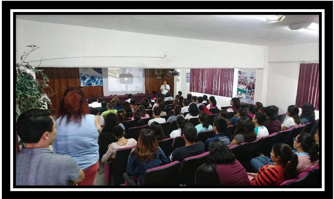
En sesión de la Policía Federal Prevención del delito 23 de Septiembre 2017.