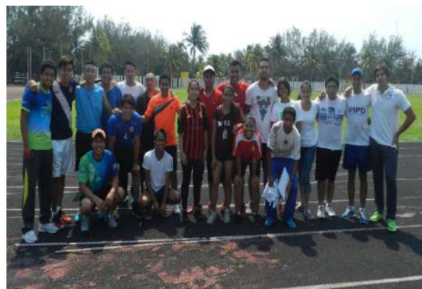
Ceremonia del Paso de la luz a los estudiantes que egresan