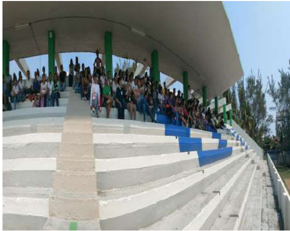
Festejando y apoyando en las canchas