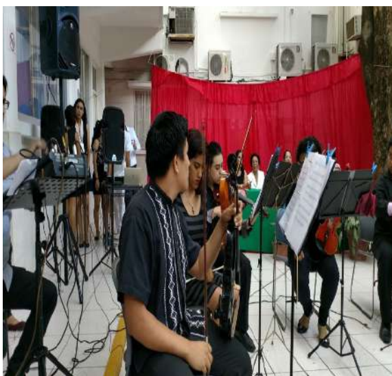
Inscripciones a diversas actividades.