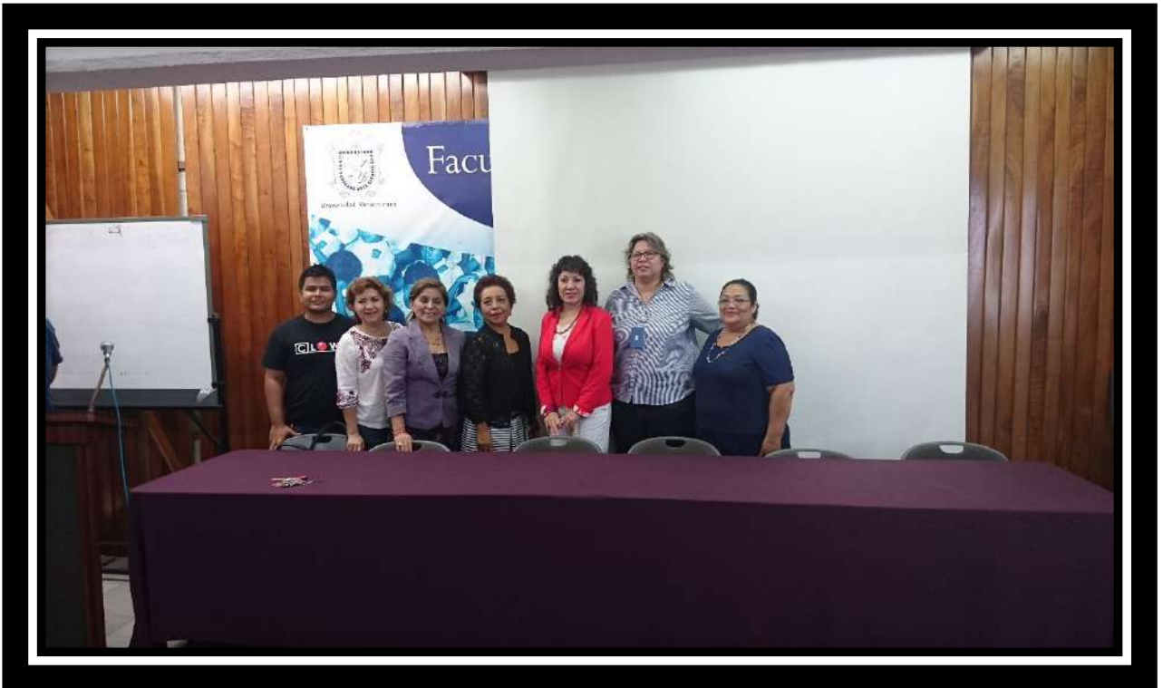
Comisión de Protección Civil Facultad de Enfermería Región Veracruz, Universidad Veracruzana.UGIR