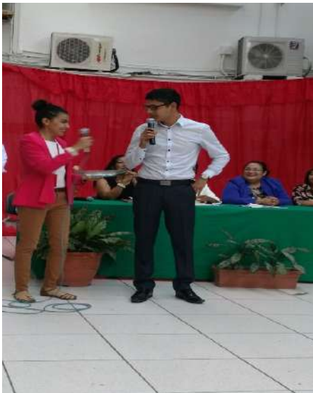
Hilos de Enfermería, evolucion histórica de la enfermería dramatización.